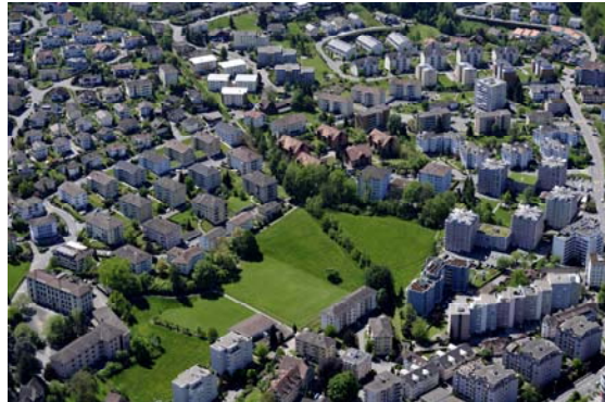
RAUM FÜRS WOHNEN