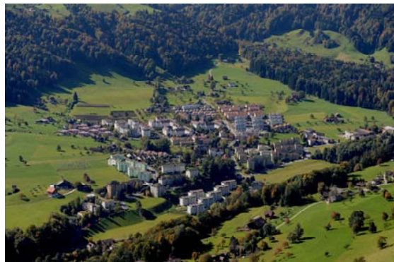
LANDSCHAFTSRAUM UND SIEDLUNGS- ÖKOLOGIE