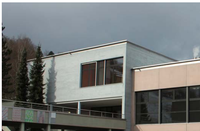
Schulanlage Roggern 1 + 2